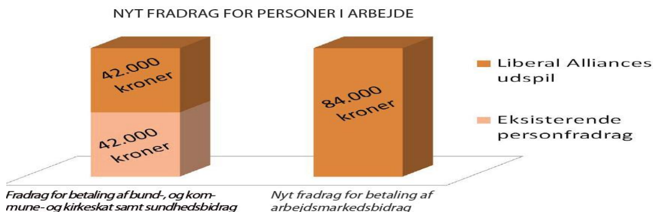
Figur: Liberal Alliances nye fradrag i den personlige indkomstskat. 4